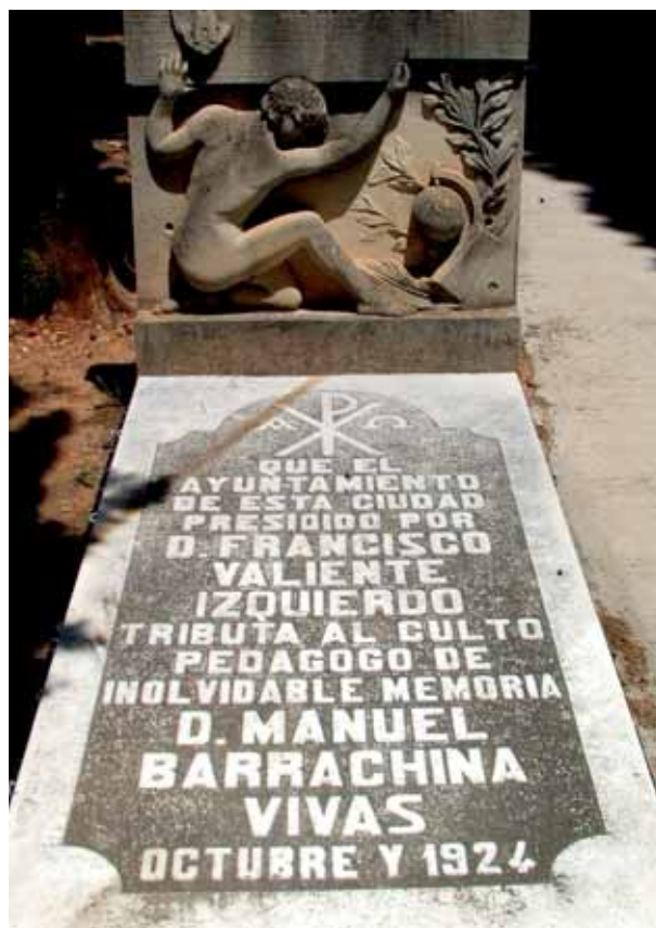
Mausoleu del Mestre al cementiri de Tavernes.